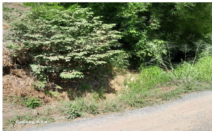
6. Vista Frontal