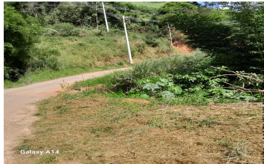
10. Vista lateral