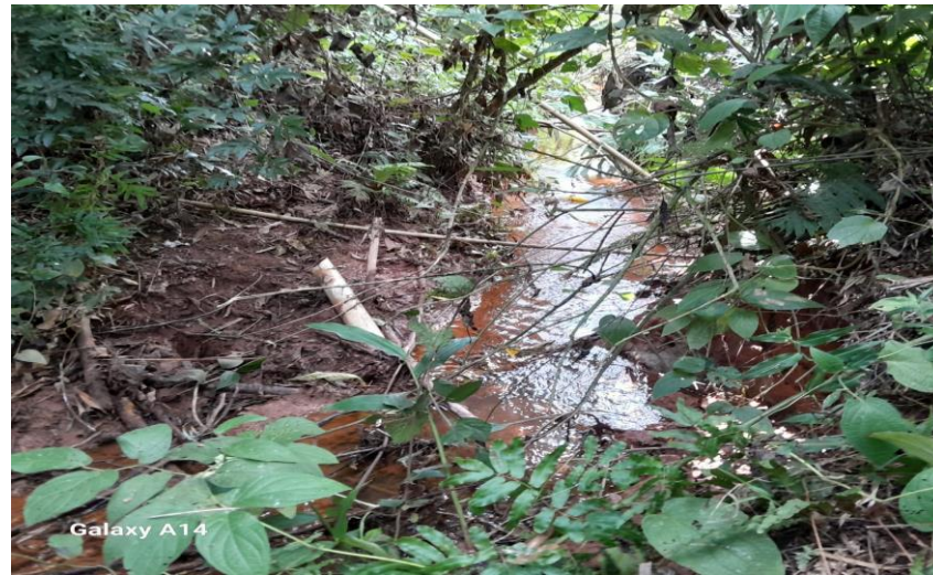
2. Vista interna Corrego