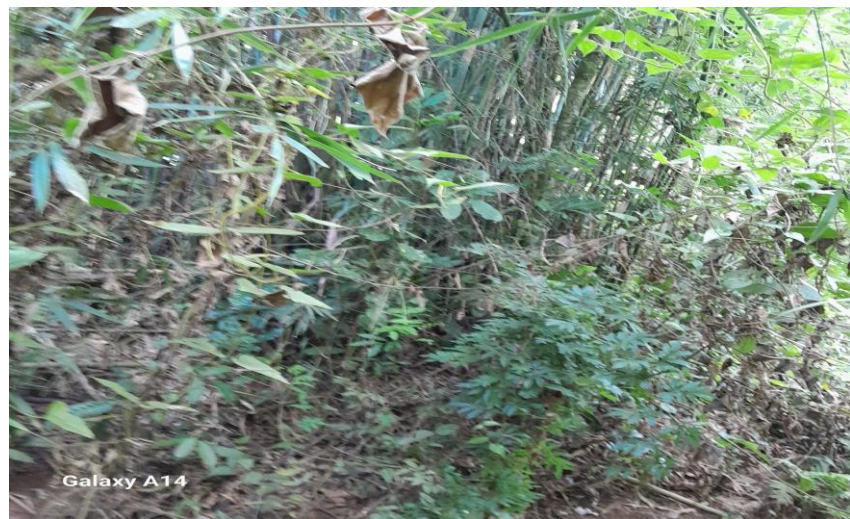
3. Vista lateral