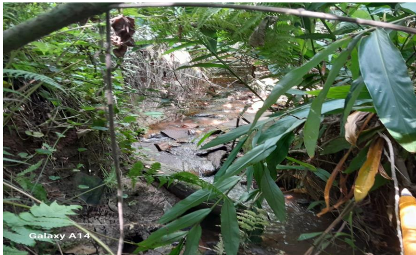
1. Vista interna Corrego