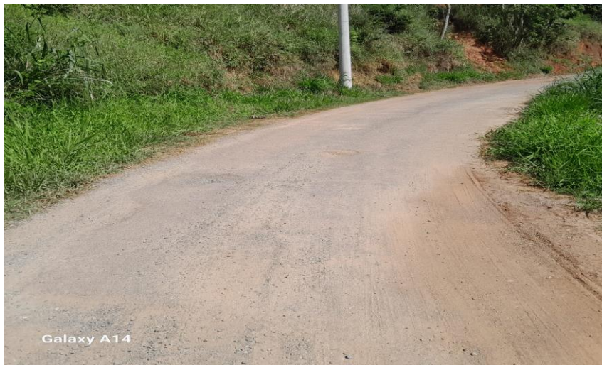
11. Visão Geral da Rua