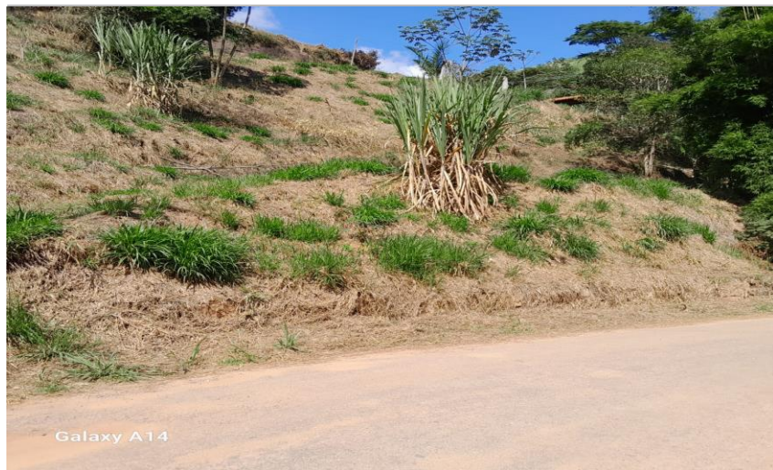
9. Visão Geral da Rua