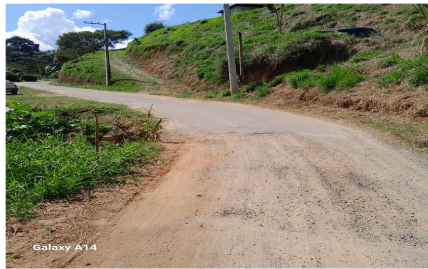
7. Visão Geral da Rua